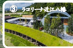
③ ラコリーナ近江八幡